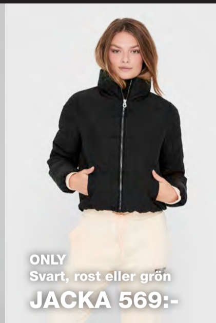
ONLY Svart, rost eller grön JACKA 569:-