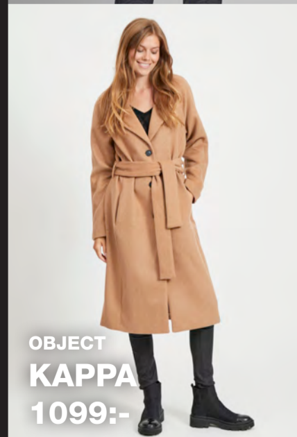
OBJECT KAPPA 1099:-